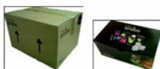
Caja/Box 1x8x25 u.