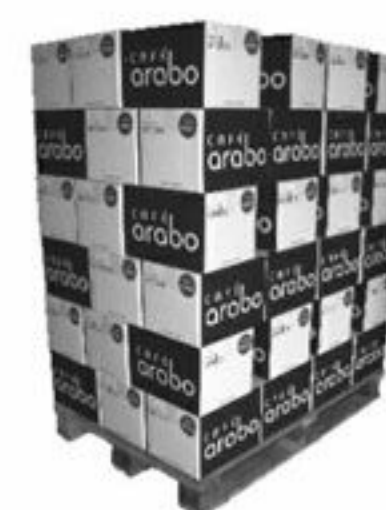
Paletización / Pallet